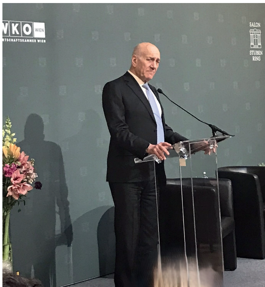
Ehud Olmert

Olmert erinnert an eine bittere Erkenntnis des Gazakriegs: Weder Israel noch die Araber – keine Seite könne die andere jemals vernichten. Daher begrüßen die beiden Politiker die Sicherheitsrats-Resolution 2735 und das Waffenstillstandsabkommen zwischen Israel und der Hamas, welches eine Freilassung aller Geiseln, ein Ende der Kriegshandlungen im Gazastreifen und seine Räumung durch die israelische Armee schrittweise vorsieht. Eine palästinensische Organisation, nur aus Technokraten bestehend, solle im Namen der P.A. den Gazastreifen verwalten und mit internationaler Hilfe wieder aufbauen. Sie sollte auch – sowohl in der Westbank als auch im Gazastreifen – die überfälligen, zuletzt 2005 abgehaltenen Wahlen vorbereiten. Zur Absicherung des reibungslosen Rückzugs der Israelis schlagen Olmert und Al-Kidwa die Aufstellung einer »Temporären Arabischen Sicherheitspräsenz« vor, die zusammen