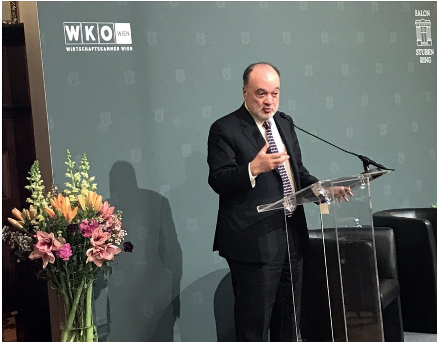
Nasser Al-Kidwa