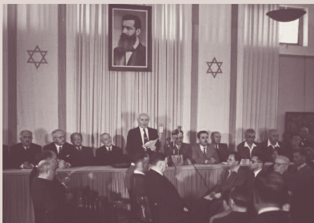
14. Mai 1948: Im Stadtmuseum von Tel Aviv ruft David Ben Gurion den Staat Israel aus.

Am Freitag, den 14. Mai 1948, um Mitternacht, würde nach 26 Jahren das britische Mandat über Palästina zu Ende gehen. Acht Stunden zuvor, um 16.00 Uhr, trat der jüdische Nationalrat unter Vorsitz von David Ben Gurion im Stadtmuseum von Tel Aviv zusammen, um die Gründung des Judenstaates zu verkünden. Da am Freitagabend bei Sonnenuntergang der Sabbat beginnt, musste vorher gehandelt werden. Unter einem überlebensgroßen Porträt von Theodor Herzl verkündete Ben Gurion die Errichtung des Staates Israel, kraft des „natürlichen und historischen Rechts“ des jüdischen Volkes auf Grund des Beschlusses der UNO-Vollversammlung vom 29. November 1947.