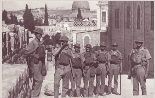
1936: Britische Soldaten im jüdischen Viertel von Jerusalem. Im Hintergrund der Felsendom.

Es war ein harter und beschwerlicher Weg gewesen. Die wichtigsten Stationen seien hier noch einmal aufgezählt: 1917 die Balfour-Deklaration – jener berühmte Brief des britischen Außenministers Balfour, in der die britische Regierung den Zionisten ihre Unterstützung beim Aufbau einer nationalen Heimstätte in Palästina zusicherte.