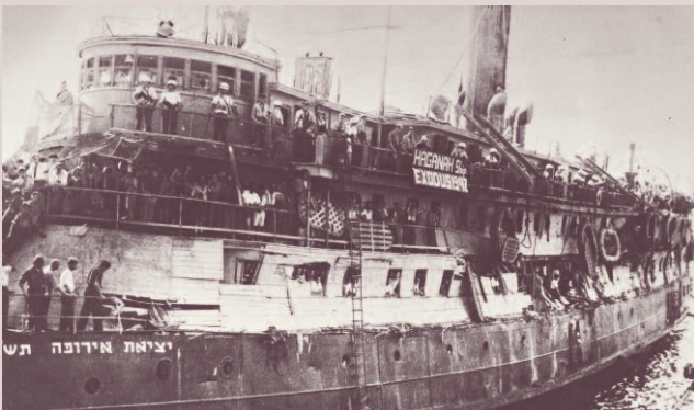
Juli 1947: Das Flüchtlings Schiff „Exodus 1947“ mit 4393 Holocaust-Überlebenden an Bord.

Im Februar 1947 legte Großbritannien sein Palästina Mandat zurück und überließ der UNO die Lösung des Problems. Die setzte daraufhin im Mai 1947 eine Untersuchungskommission ein, die sich mehrere Wochen in Palästina aufhielt. Ihre Arbeit wurde von zwei gravierenden Ereignissen überschattet. Zum einen erhängte die Irgun zwei britische Unteroffiziere – mit den Köpfe nach unten –, nachdem zuvor drei Irgun-Kämpfer getötet worden waren. Zum anderen gab es das Drama um das Flüchtlings Schiff „Exodus 1947“ mit 4393 Holocaust-Überlebenden an Bord.