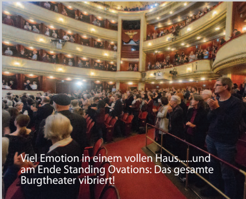
Viel Emotion in einem vollen Haus.....und am Ende Standing Ovations: Das gesamte Burgtheater vibriert!

gingen gegen das Anti-Ausländer Volksbegehren auf die Straße. Zivilcourage ist nach wie vor ein wesentlicher Motor für ein menschenwürdiges Leben.