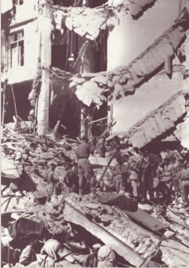
22. Juli 1946: Im Kampf gegen die Briten in Palästina sind fast alle Mittel recht. Hier der Südflügel des King David Hotels in Jerusalem nach der Sprengung durch die Irgun unter Menachem Begin. 91 Briten, Araber und Juden werden getötet.

tier der britischen Mandatsverwaltung. 91 Menschen wurden getötet. Als Reaktion darauf verschärften die britischen Militärbehörden ihre Gangart, während die jüdischen Organisationen die illegale Einwanderung nach Palästina erfolgreich fortsetzten. Bis Anfang 1948 organisierte die Fluchthilfe-Organisation Bricha (hebräisch „Flucht“) mit Sitz in Salzburg diese Aktionen. Etwa 250 000 Juden erreichten nach Palästina.