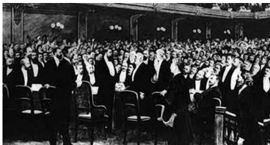
Zionistenkongress in Basel, 1897, Theodor Herzl

Der Staat Israel ist aus einer Idee hervorgegangen. Das Bedingungsgefüge für diese Idee war europäisch und von Phänomenen der Moderne gekennzeichnet. Es war der in Europa aufkommende neuzeitliche Nationalismus und der postemanzipatorische, politische Antisemitismus, die als Geburtshelfer einer eigenen jüdischen Nationalbewegung, also des Zionismus, dienten. Die Idee dieser Bewegung war nicht rein künstlich „konstruiert“, sondern beruhte auf der alten messianischen Heilserwartung der Juden eines Tages in ihre Urheimat zurückzukehren. Neu war das Konzept, das alte ethnoreligiöse Motiv national und säkular umzudeuten.