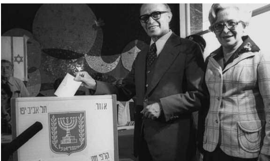
Menachem Begin und Aliza Begin bei der Wahl in Tel Aviv, 17. Mai 1977

Es war eine Allianz von bürgerlichen Mittelschichten und soziökonomisch und kulturell an den Rand gedrängten Gruppen der Misrachim.