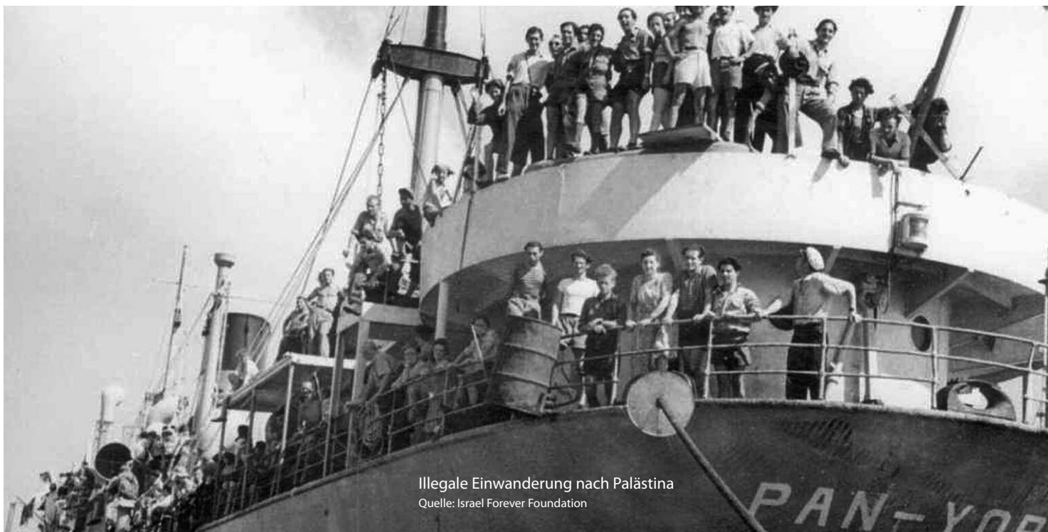
Illegale Einwanderung nach Palästina

und nach außen verteidigt werden. Die revolutionäre und utopische, zum Teil anarchisch sich artikulierende Pionierideologie wurde staatlich eingehegt. Sie sollte den Zwecken des Staates ( raison d'état ) untergeordnet und der Realpolitik angepasst