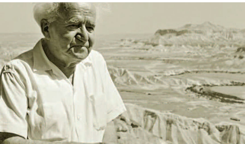
David Ben-Gurion, im Hintergrund die Negev Wüste

Im Zeitalter der Moderne dienten das Individuum, die Klasse und die Nation als Bezugsgrößen der Identität. So verhielt es sich auch in Israel. Sie waren Fixpunkte liberaler, sozialistischer und nationaler Denkfiguren, die das Raster des öffentlichen Diskurses in Israel auszeichneten. Sie gaben vor universal zu sein, waren aber dem europäischen Bedingungsgefüge entlehnt.