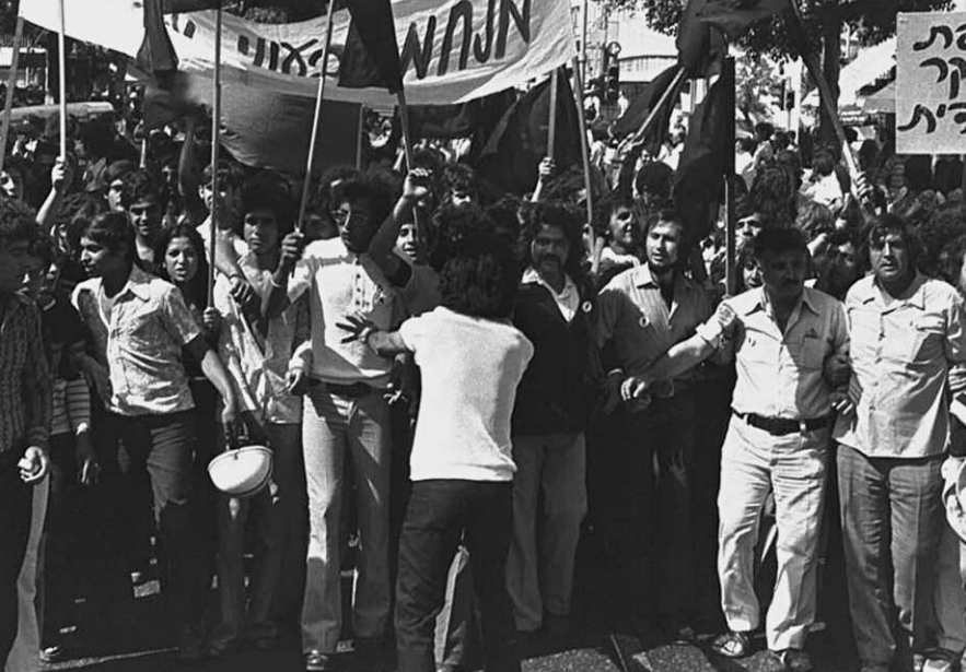
Demonstration der „Black Panthers“ in Tel Aviv am 1. Mai 1973