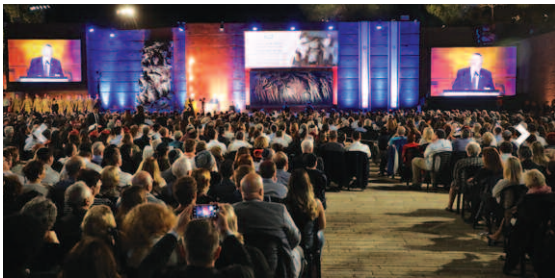
Shoah Gedenkveranstaltung, Mai 2019 in Yad Vashem

eine partielle Umorientierung von der zukunftsorientierten, konstruktiven und optimistischen Ausrichtung des zionistischen Projekts, im Sinne der Gründerideologie, auf eine rückwärtsgewandte, von Traumata jüdischer Schicksalsgemeinschaft gezeichnete Grundhaltung. Auch die durch die Kriege von 1967 und 1973 heraufbeschworenen Existenzängste gemahnten an die Shoah.