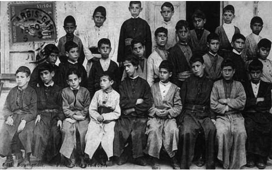
Geschichte orientalischer Juden: Schulklasse der franko-jüdischen „Alliance Israelite Universelle“ in Tetuan, Marokko, um 1910

orientalischer Herkunft, nach der Vertreibung der Juden aus der Iberischen Halbinsel, komme zu kurz? Seit 1976 sind diese Themen zunehmend in die Schulbücher eingegangen. Vielleicht nicht genug, das mag sein. Kann überhaupt eine künstliche Symmetrie in der Behandlung der westlichen und orientalischen Juden gerechtfertigt werden? Lehrpläne der Geistes- und Sozialwissenschaften können nicht quantitativ austariert werden, sondern der Relevanz und der tatsächlichen historischen Wirkungsmacht der Themen entsprechend erstellt werden. Vor der Shoah machten die Juden in arabischen und moslemischen Ländern sowie die Nachkömmlinge der hispanischen Juden im Balkan weniger als Zehntel der weltweiten jüdischen Bevölkerung aus. Leider ist die Stundenzahl der geistes- und sozialwissenschaftlichen Fächer in den Schulen sowieso gering und die Kenntnisse der jüdisch-europäischen und allgemeinen Geschichte sind schon eh spärlich. Nun sollen diese noch mehr gekürzt werden zugunsten dieser thematischen Neugewichtung. In Universitäten sollen Lehrfächer über die Kultur und Ge-