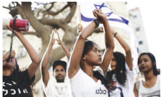
Äthiopische Israelis protestieren in Tel Aviv gegen Gewalt und Rassismus, 2015

In dem Identitätsdiskurs wirken neben den besagten, oft zynischen, Politikern auch eine kleine, aber durchaus medienwirksame Gruppe von linksliberalen Intellektuellen und Kulturschaffenden, meist orientalischer Abstammung, mit. Sie importierten aus den USA die Denkfiguren dieses Diskurses. Der Begriff Identitätspolitik ( identity politics ) entstammt den Cultural Studies. Er wurde den emanzipatorischen Bewegungen diskriminierter sozialer Gruppen zugeschrieben, wie etwa der Bürgerrechtsbewegung in Amerika. Dort began-