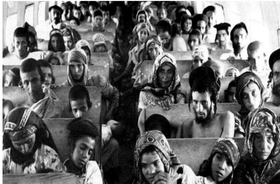
Yemenitische Juden en route von Aden nach Israel, während der Operation „Magischer Teppich“, 1949–1950

schen Rhetorik und den als zurückgeblieben empfundenen jüdischen Einwanderern aus arabischen Ländern tat sich schon früh kund.