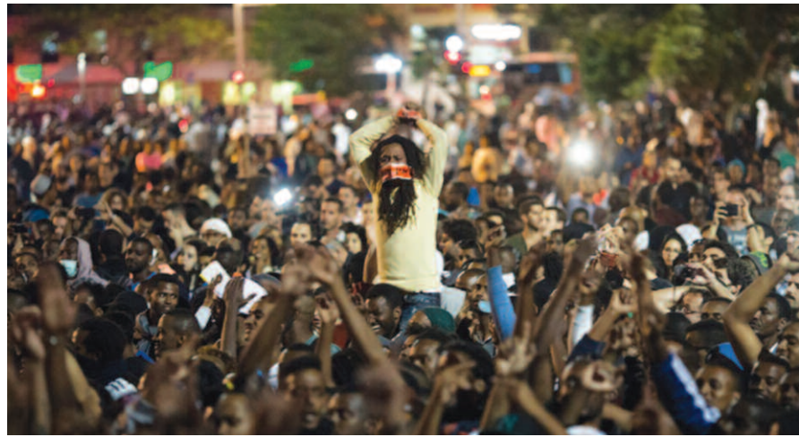
Protest äthiopischer Aktivisten und Aktivistinnen gegen Polizeigewalt, 2015

Ein Teil dieser Gruppe bedient sich der postmodernen und antikolonialistischen Rhetorik und versteht sich als postzionistisch. Er fordert von daher die „Dekonstruktion“ des zionistischen „Meganarrativs“ der Neuschöpfung eines nationalstaatlichen, hebräischen Kollektivs, wie von den Grün-