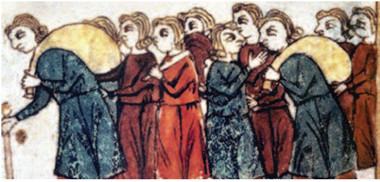
Geschichte sephardischer Juden: Hunderttausende wurden im 15. Jh. aus Kastilien ausgewiesen. Spanische Illustration aus dem Mittelalter