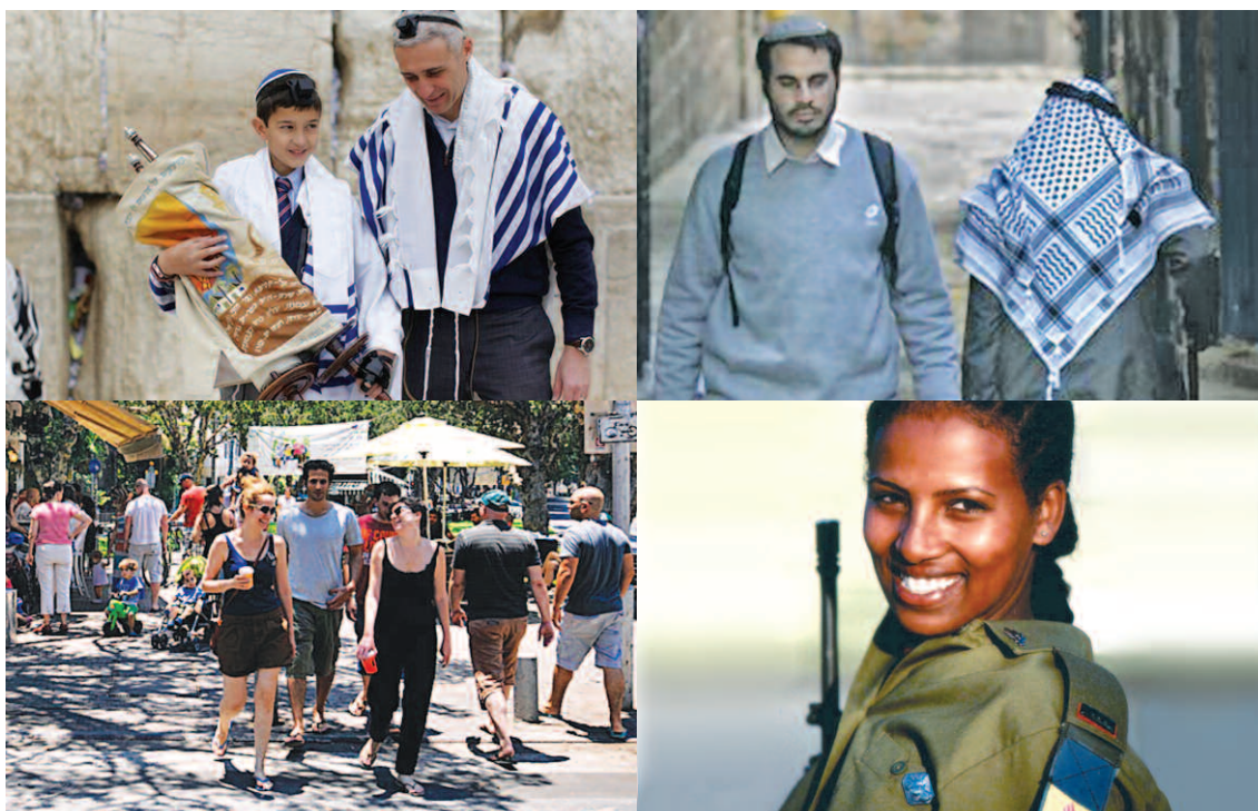
Beispiele der Vielfalt der israelischen Gesellschaft

In der Armee, früher eine wichtige Integrations-schiene, dienen nur noch 50% der betroffenen Altersgruppe. Verschiedene Erfahrungsräume erzeugen verschiedene Erwartungshorizonte. Dem bisherigen Konsens des jüdisch-demokratischen Staats entgegen die ultraorthodoxen mit theokratischer Heilserwartung, während israelische Araber mit der Idee einer allgemeinen Staatsbürgerschaft oder der eines Mehrvölkerstaates spielen. Die Option der Zwei-staatenlösung zwischen Juden und Palästinensern wird durch die bi-nationale Vorstellung von anderen hinterfragt, die entweder den jüdischen oder den demokratischen Charakter Israels zu untergraben