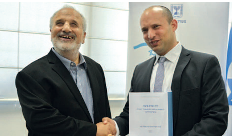
Der Biton-Report, Erez Biton und Naphtali Bennett, 2016

schwingen z. T. in dem Jargon des Biton-Reports mit. Postmoderne Termini wie Narrativ, Hegemonie, Orientalismus, Eurozentrismus, Anti-Kolonialismus, Kulturelles und Symbolisches Kapital durchwirken den Report. Er ist nicht frei von Widersprüchen, die aus den entgegengesetzten Denkfiguren der postzionistischen Intellektuellen und der zionistischen Auftraggeber und Mitautoren einschließlich des Namensgebers der Kommission herrühren. So lebten die Misrachim angeblich in Harmonie mit der arabischen Umwelt, sie gehörten einer traditionellen Gesellschaft an, die zuerst durch den europäischen Kolonialismus in Konflikt mit ihren Traditionen und mit ihrer arabischen Umwelt geriet. Denn ein Teil der Juden nahm sich der Kultur der Kolonialmächte an. Sie waren nicht zionistisch und nicht nationalistisch. Im Gegenteil, der Zionismus, der den europäischen Juden einen Ausweg bot, belastete noch mehr das Verhältnis von Juden zu ihrer arabischen Umwelt. Im Gegenzug soll der Behandlung des Zionismus und der modernen hebräischen Aufklärung, die nun einmal zum historischen Bedingungsgefüge Europas und des aschenasischen Judentums gehören, eine ebenbürtige Darstellung jüdischer Gebildeter in der arabischen Welt und vermeintlicher oder wirklicher Vordenker einer protozionistischen Variante orientalischer Prägung folgen.