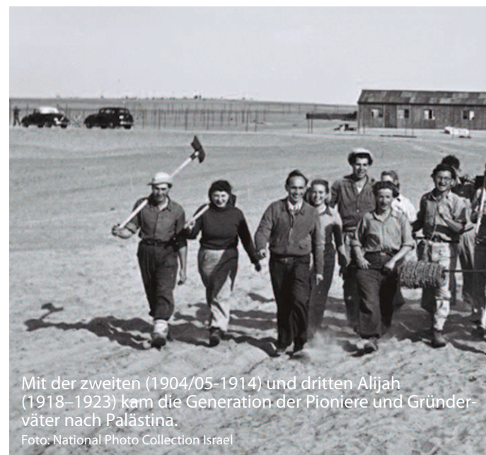
Mit der zweiten (1904/05-1914) und dritten Alijah (1918-1923) kam die Generation der Pioniere und Gründer-väter nach Palästina.

als stolze Israelis annehmen sollte. Die Ein-ebnung der von den vermeintlichen Verwerfungen der Diaspora gezeichneten, partikularen Identitäten der verschiedenen Einwanderungsgruppen zugunsten eines neuen kollektiven Bewusstseins, das sozusagen dem ideologischen Reißbrett entnommen wurde, führte den Namen – Schmelzriegel-ideologie . Die Bausteine des neuen kollektiven Bewusstseins bestanden aus dem Pionierethos und der erwähnten Devise der mamlachtiut . Letztere sollte den Neuankömmlingen ein staatsbürgerliches Bewusstsein einzuflößen. Die Diaspora habe, so Ben Gurion, einen korrumpierenden Effekt auf viele Juden gehabt. Er war von der Idee beseelt nicht nur eine normale, sondern gar eine mustergültige Nation zu schaffen. Er verwendete die Metapher or la'goim (Licht der Nationen), wie es im Buche Jesaja