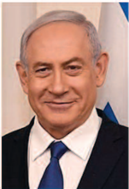
Benjamin Netanjahu, Likud