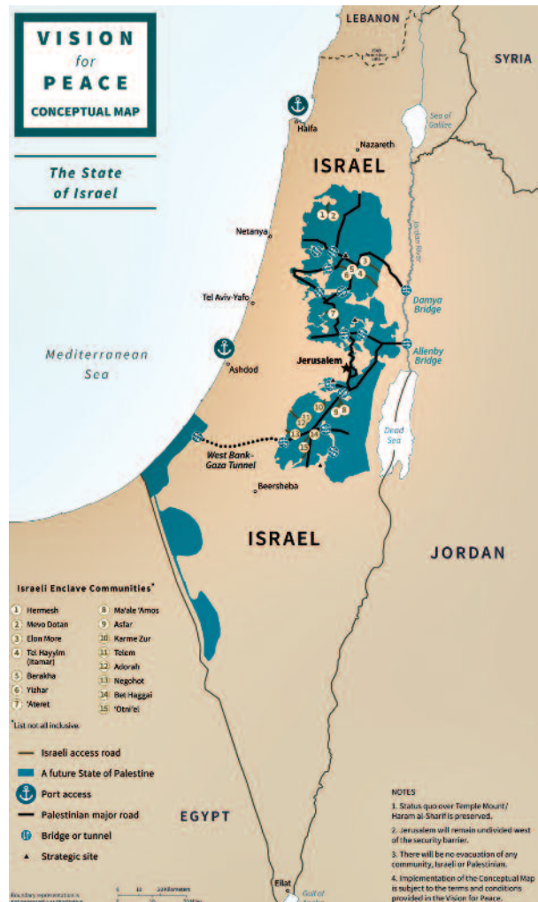
Quelle: US Government, Trump Peace Deal

Der Status von Jerusalem wird den momentanen Realitäten angepasst. Bezüglich der heiligen Stätten bleibt der Status der Verwaltung aufrecht, allerdings erweitert um das Recht aller Menschen (nicht nur der Muslime) am Tempelberg zu beten.