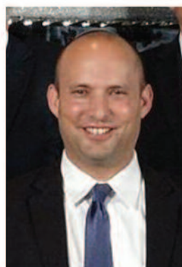
Naftali Bennett, Jamina

bleibt stabil bei 59 Mandaten, während seine Herausforderer bestenfalls 52 Mandate auf die Beine stellen.