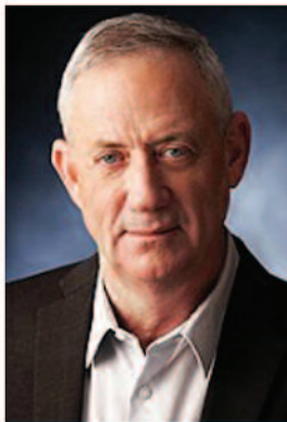
Benny Gantz, Kachol Lavan