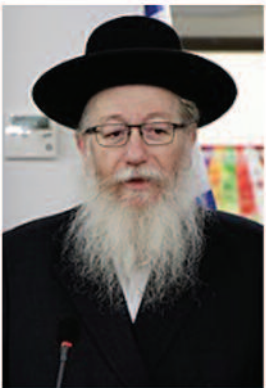
Yaakov Litzman, Vereinigtes Thora-Judentum