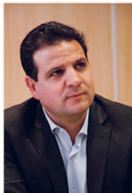
Ayman Odeh, Vereinte Liste