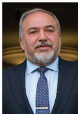
Avigdor Lieberman, Jisra'el Beiteinu