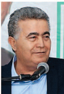
Amir Peretz, Awoda-Gescher-Meretz