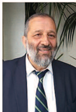
Arje Deri, Schas