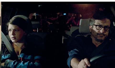
The Day After I Am Gone / Nimrod Eldar / 2019

Charakter personifiziert sich genau jene kulturelle Repräsentation des Nahostkonflikts, ohne den der israelische Film offenbar in Europa nicht zu haben ist.