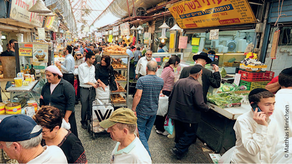
Mahane Yehuda, Markt in Jerusalem

gibt es die in Deutschland nur an separaten Ständen auf den Wochenmärkten und niemals an den Fleischtheken von Rewe, Edeka oder Aldi: Pferdefleisch . Doch nur wenige wissen, dass die christlich deutsche Abscheu gegen Pferdefleisch einen ähnlichen Ursprung hat, wie das Verbot der Götterspeise „Zicklein in der Milch seiner Mutter“. St. Bonifatius hatte vor über 1.000 Jahren den Genuss von Pferdefleisch verboten, weil die alten Germanen es ihren Göttern opferten. Und erstaunlicherweise halten sich bis heute viele an dieses „Koscher“-Gebot, ohne zu wissen, warum.