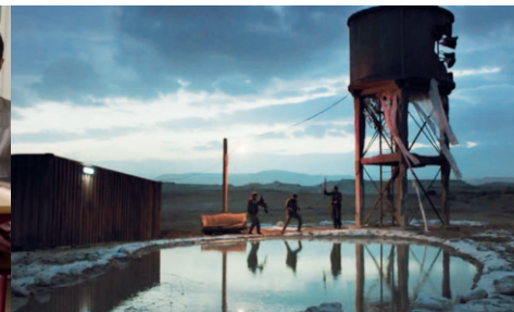
Foxtrot / Samuel Maoz / 2017

selbstverständliche – Selbstkritik israelischer Künstler*innen ein ungewöhnliches Potential nach Europa.