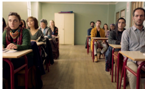
Synonymes / Nadav Laoid / 2019

Voller Symbole, voller Synonyme erzählt Lapid mit diesem Film aus seiner Biografie, welche von der Auseinandersetzung mit der persönlichen Identitätsfindung handelt. Neben der autobiografischen Narration ist das Werk jedoch eine klare nationale Selbstkritik . Eine solche ist freilich Aufgabe der Kunstwelt, die sich herkömmlicherweise kritisch und auf der politischen Skala links präsentiert und präsentieren muss. Doch bringt diese – ganz