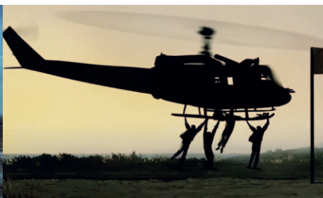
Waltz With Bashir / Ari Folman / 2009

Die Ambivalenz israelischer Filme und damit die Ambivalenz israelischer Realität wird also in der Auswahl europäischer Festivals strukturell unterschlagen, jedoch soll mit dieser kritischen Beobachtung keinesfalls die überzeugende Rolle des israelischen Films als Kultur-Botschafter*in infrage gestellt werden, denn selbst die kritischen Filme schaffen es immer wieder, Nuancen und Leerstellen zu zeigen, von denen man in Europa nichts weiß. Gerade das Queer Israeli Cinema hat diesen Beweis erbracht, aber auch jüngere feministische Produktionen wie „In Between“, in welchem gemäß dem programmatischen Titel die Situation junger, moderner israelisch-arabischer Frauen in Tel Aviv gezeigt wird, zeugen davon.