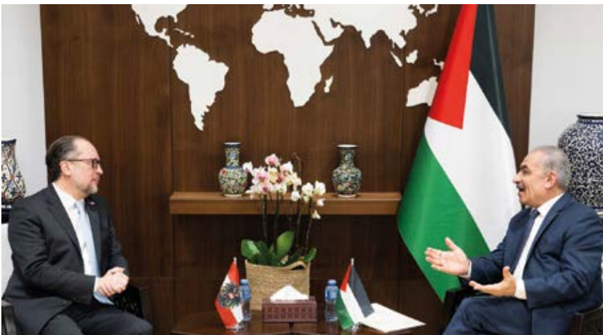
Alexander Schallenberg mit dem palästinensischen Ministerpräsidenten Mohammad Shtayyeh

Israel und die israelische Armee sei laut Österreichs Außenminister bei jedem Einsatz gefordert, zu unterscheiden zwischen Terroristen der Hamas und der Zivilbevölkerung in Gaza, die geschützt werden muss. Gerade unter Freunden müsse man auch kritische Themen ansprechen können. So scheute Außenminister Schallenberg nicht davor, die Siedlergewalt, die Ausweitung von Siedlungen und Provokationen bei den Heiligen Stätten in seinen Gesprächen in Israel in aller Deutlichkeit zu verurteilen. Zudem verwies er auf die Notwendigkeit einer langfristigen Perspektive für eine Zwei-Staaten-Lösung, damit Israelis und Palästinenser Seite an Seite in Frieden leben können.